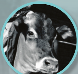
La vache 'Brown Eyes'