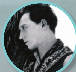
Buster Keaton 'Friendless'